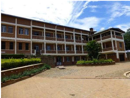
Maison régionale à Andraisoro