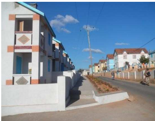
Une rue du village du Père Pedro